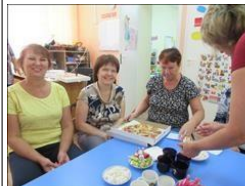
Кофе-пауза во время обучающего семинара-тренинга "В детский сад пришел приемный ребенок" Фотография сделана во время кофе-паузы.