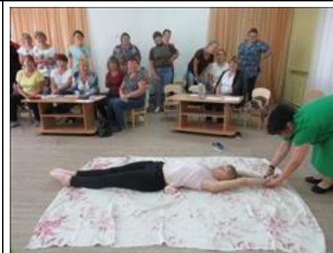
Упражнение на профилактику эмоционального выгорания.