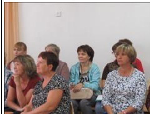
Обучающий семинар для специалистов детских садов "В детский сад пришел приемный ребенок" Участники семинара. Воспитатели детских садов Пудожского района.