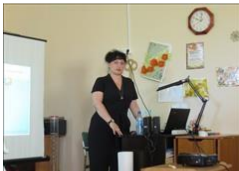
ведущая семинара Фотография сделана во время проведения семинара.

Электронные версии материалов (бюллетеней, брошюр, буклетов, газет, докладов, журналов, книг, презентаций, сборников и иных), созданных с использованием гранта в отчетном периоде (при условии, что такие материалы не содержатся в материалах, указанных в подпункте 5 настоящего пункта)