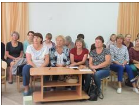
Участники обучающего семинара для специалистов детских садов "В детский сад пришел приемный ребенок" На фотографии специалисты детского сада № 46 гор. Пудожа