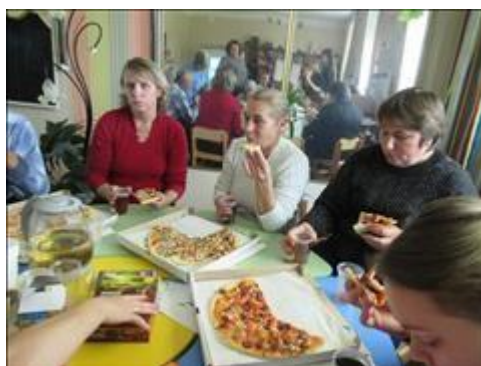
участники семинара Фотография сделана во время кофе-паузы