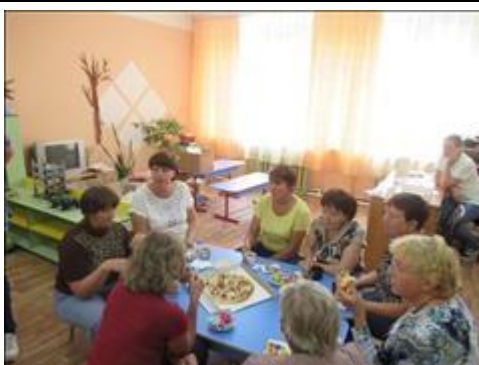
Кофе-пауза во время обучающего семинара "В детский сад