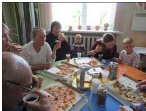
Участники семинара Фотография сделана во время кофе-паузы