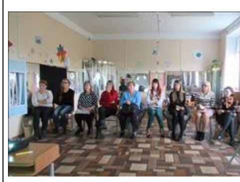
участники семинара Фотография сделана во время проведения семинара