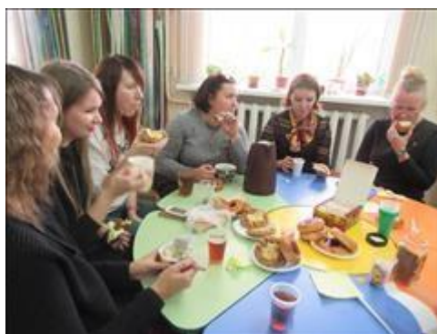
участники семинара Фотография сделана во время кофе-паузы