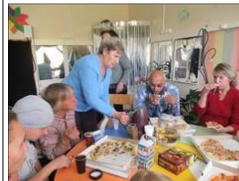
участники семинара Фотография сделана во время кофе-паузы